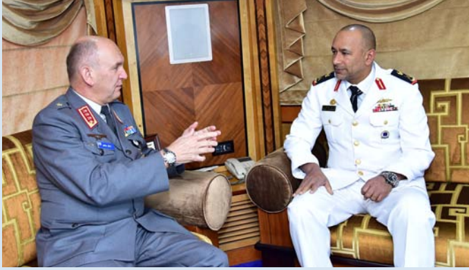
المشرخ مستقبلاً نائب وزير الدفاع الفنلندي

استقبل سعادة اللواء الركن بحري إبراهيم سالم محمد المشرخ قائد القوات البحرية بمكتبه في معرض الدفاع الدولي "آيدكس 2015" اليوم اللواء أرتوراتي نائب وزير الدفاع الفنلندي والعميد الركن بحري خليفة بن عبدالله آل خليفة قائد سلاح البحرية الملكية البحريني والفريق محمد ذكاء الله قائد القوات البحرية الباكستانية وتم خلال الاجتماعات التي حضرها عدد من كبار ضباط القوات البحرية وأعضاء الوفود الزائرة استعراض أوجه التعاون، ومناقشة عدد من المواضيع العسكرية المشتركة.