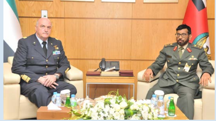
الرميثي مستقبلاً نائب القائد الأعلى لقوات التحالف

استقبل اللواء الدكتور خليفة محمد ثاني الرميثي الوكيل المساعد للسياسات والشؤون الاستراتيجية بمكتبه في معرض «آيدكس» أمس الفريق أول ماركو ذولياني نائب القائد الأعلى لقوات التحالف للتحويل الذي يزور البلاد لحضور فعاليات المعرض. وتم خلال الاجتماع الذي حضره عدد من ضباط وزارة الدفاع وأعضاء الوفد المرافق للضيف، استعراض أوجه التعاون والتنسيق القائم بين الجانبين، إلى جانب مناقشة عدد من المواضيع العسكرية ذات الاهتمام المشترك.