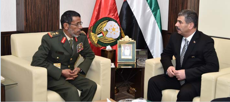
.. ومستقبلاً وزير الدفاع في اذربيجان

استقبل سعادة الفريق الركن حمد محمد ثاني الرميثي رئيس أركان القوات المسلحة بمكتبه في معرض "إيدكس 2015" على حدة أمس كلا من معالي ذاكر حسنوف وزير الدفاع في اذربيجان واللواء عبد الرزاق الناضوي رئيس الأركان الليبي والفريق سيرجي جورولوف رئيس لجنة الدولة للشؤون العسكرية الصناعية البيلا روسي و اللواء الركن حسن بن حمزه الشهري قائد قوات درع الجزيرة المشتركة.