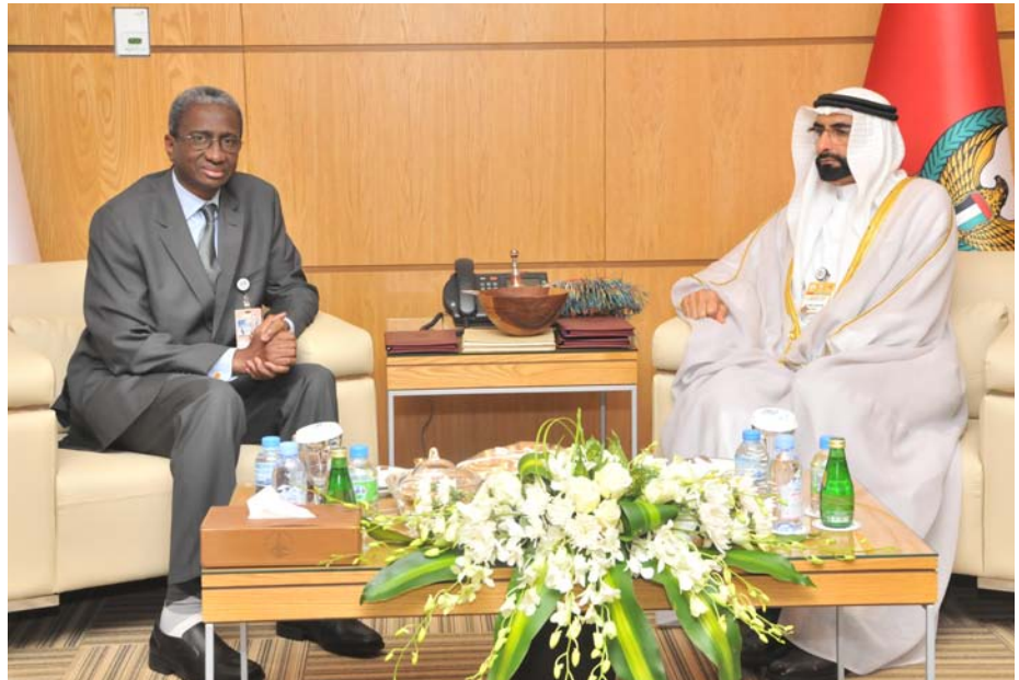
البواردي مستقبلاً وزير الدفاع الوطني الموريتاني

استقبل معالي محمد أحمد البواردي الفلاسي وكيل وزارة الدفاع بمكتبه في معرض «آيدكس 2015» بمركز أبوظبي الدولي للمعارض أمس كلا على حده معالي الفريق مهندس عبدالرحيم محمد حسين وزير الدفاع السوداني ومعالي جالو ممدو باتيا وزير الدفاع الوطني الموريتاني ورحب معالي وكيل وزارة الدفاع بالوزيرين وبحث معهم علاقات وواجه التعاون القائمة بين دولة الامارات العربية المتحدة ودولهم وجوانب تفعيلها وتطويرها بما يخدم المصلحة المشتركة إضافة إلى الشؤون ذات الصلة بالمجالات العسكرية والدفاعية.